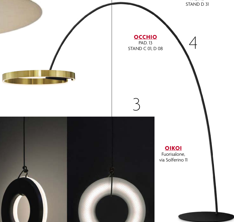
OCCHIO PAD. 13 STAND C 01, D 08