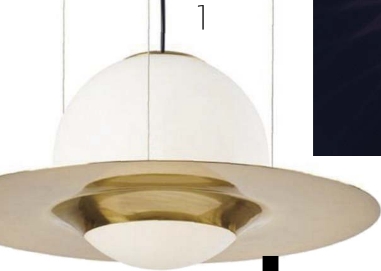
SFORZIN PAD. 13 STAND H 27, L 20