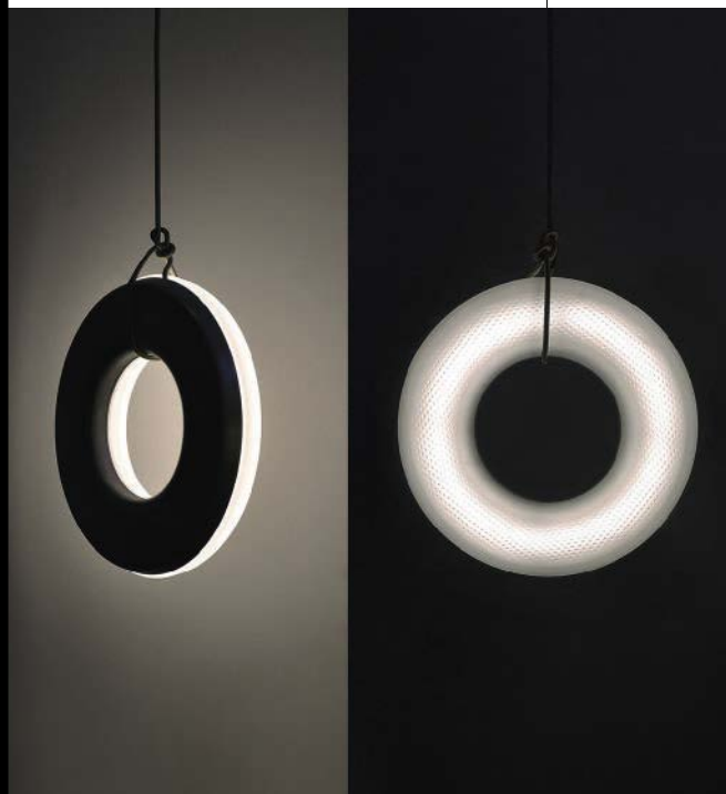
OIKOI Fuorisalone, via Solferino 11